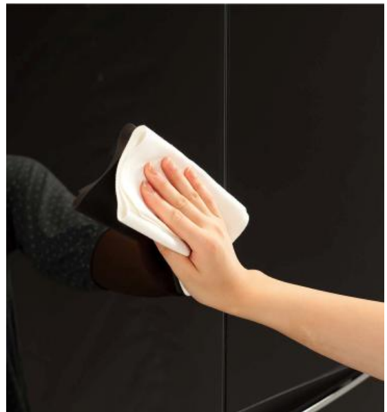
汚れやすい扉のお手入れもしやすい「ガラスストップ」

冷蔵庫はガスレンジ以上に、家族やお客さまの目に触れる機会が多いため、美しさを保つ「ガラスストップ冷蔵庫」は今後、ガスレンジのように定着して行くと考えています。