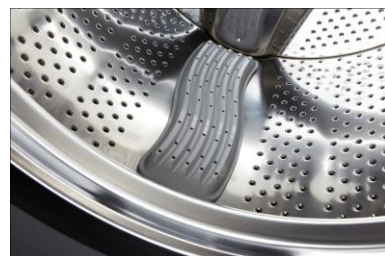
<洗濯板状のバッフル>

また、ドラム式ではタオルのパイルがたたき洗いによって倒れてしまうため、天日干しした際のゴワつきが気になる、といった声も聞かれましたが、洗濯板で洗うことで、倒れたタオルのパイルを起しながら洗うため、天日干ししてもゴワつきを抑えることができます。