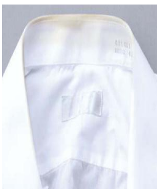
オゾンすすぎ無し