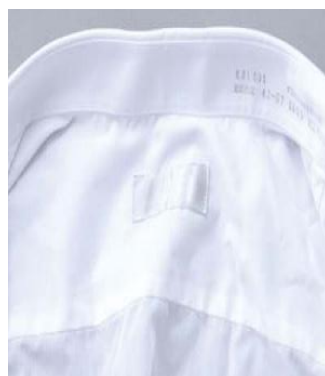
オゾンすすぎ有り