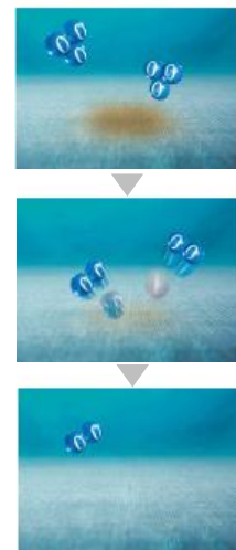
オゾンすすぎの 洗浄イメージ

泥汚れを洗う「洗濯板」と皮脂汚れ・ニオイ汚れを洗う「オゾンすすぎ」の2回洗いができるから、衣類に汚れを残さず、しっかり洗い上げることができます。