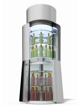
（仮称）円柱型冷蔵庫「Tower」