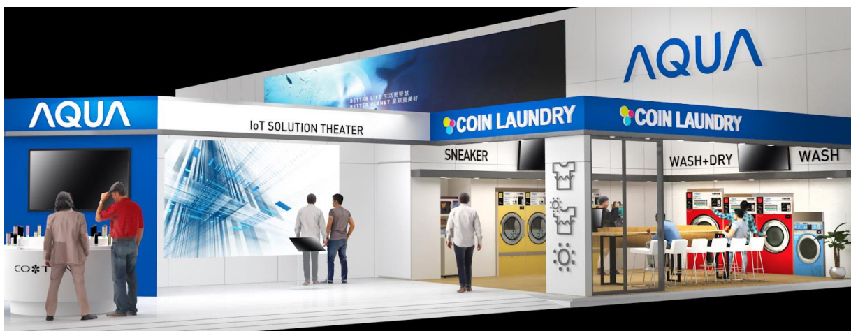
AQUA 出展ブース(イメージ)

日本国内のコインランドリー市場の拡大傾向と日本ブランドに対する信頼性から、AQUAにも海外から高い関心が寄せられています。AQUAは、独自のITランドリーシステムの利便性と様々なデータ分析により、今までにないサービスと市場の創出を目指し、業務用洗濯機の海外展開の可能性を検討してまいります。