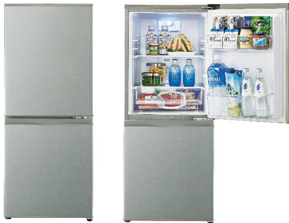
2ドア冷凍冷蔵庫 AQR-13G (定格内容積 126L) (S)ブラッシュシルバー

健康志向や節約志向が高まる中、家で食事を摂る単身世帯に適した2ドア冷凍冷蔵庫「and Smart(アンドスマート)シリーズ」(AQR-13G:定格内容積 126L)を発売します。天面には耐熱 100°Cテーブルを採用し、オープンレンジも置くことができます。※1 冷凍室は冷凍食品などもたっぷり収納できる 46L の大容量を確保、また、冷蔵室庫内には生鮮食品の保存に適した「低温フリーケース」が内蔵されているので、作り置きのおかずの保存など幅広く使うことができます。