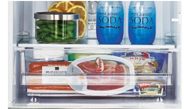
〈低温フリーケース〉