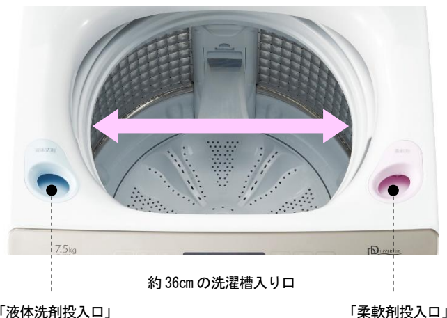
約 36cm の洗濯槽入り口