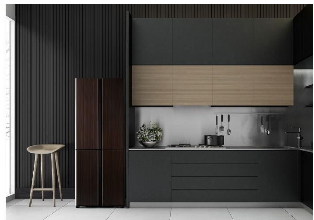
右: (T) ダークウッドブラウン