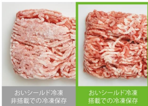
おいシールド冷凍 非搭載での冷凍保存