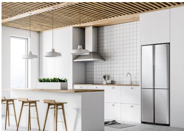
AQR-TZ42K 左: (S) サテンシルバー

アキュ株式会社(本社:東京都中央区、代表取締役社長 兼 CEO:杜 鏡国)は、世界的プロダクトデザイナー深澤直人氏のデザインによる、うす型設計の冷凍冷蔵庫「TZ シリーズ」より新商品 AQR-TZ42K を 4 月 15 日(木)に発売します。