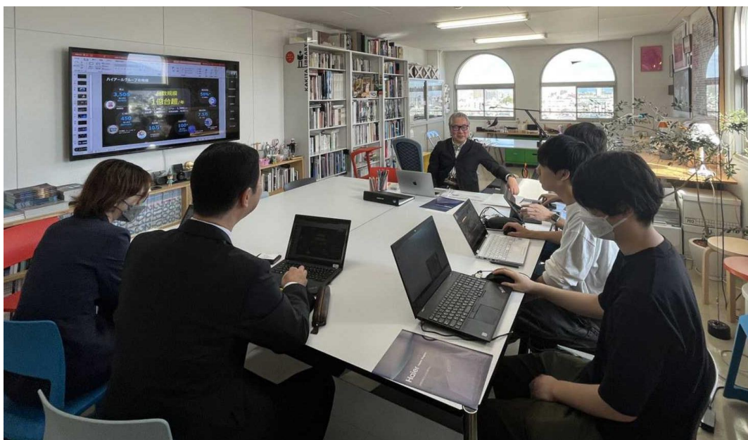
キックオフミーティングの様子

※ ユーロモニター・インターナショナル「Global Major Appliances 2022 Brandランキング」の調査結果 「大型家電」には冷蔵庫、冷凍庫、洗濯機、食器洗い機、電子レンジ、キッチン家電を含む